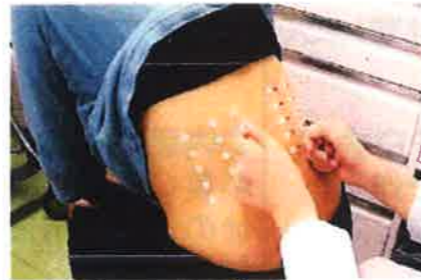
図9 パッチテスト貼付時

“パッチテスト”とは、試薬のついたテープを背中に貼り、除去後、皮膚に現れた反応に基づいてアレルギーの有無を判断するものです。